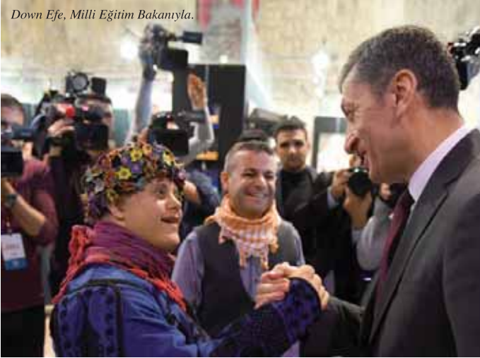
Down Efe, Milli Eğitim Bakanıyla.

Salihli Özel Eğitim Uygulama Okulu 27 Aralık 1992 tarihinde Eğitilebilir Özürlüleri Koruma Derneği'nin girişimleri ile Namık Kemal İlköğretim Okulu bünyesinde açıldı. Şehitler Mahallesi Derbent Caddesi üzerinde eski yıkıntı bir evin restore edilmesi üzerine, 1 öğretmen ve 8 öğrenci ile eğitim öğretime başlayan okulda, daha sonra öğretmen sayısı 2, öğrenci sayısı da 24'e yükseldi.