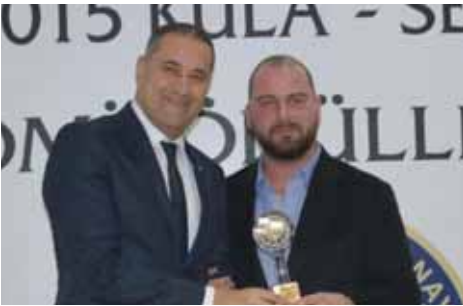
Kula 35 yıllık Kula Madensuyu