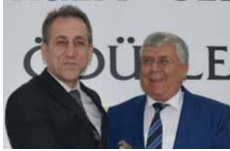
Kula 35 yıllık Ziraat Bankası Kula