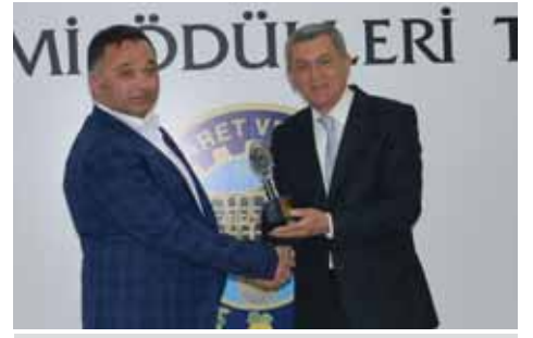
Kula Kurumlar Vergisi 5. Yurttaş Tarım