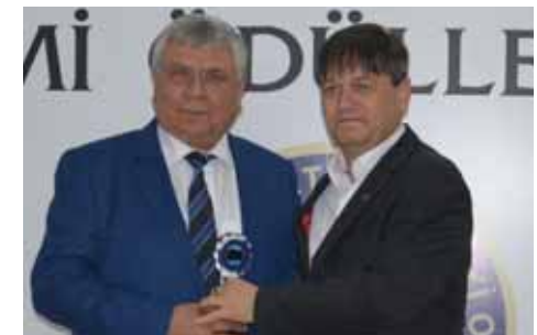
Selendi Kurumlar 9. Kayalar Süt