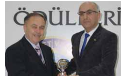
Selendi Kurumlar 5. Kevser Süt