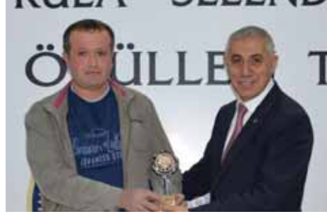
Kula Gelir Vergisi 3. Nuri Yapı