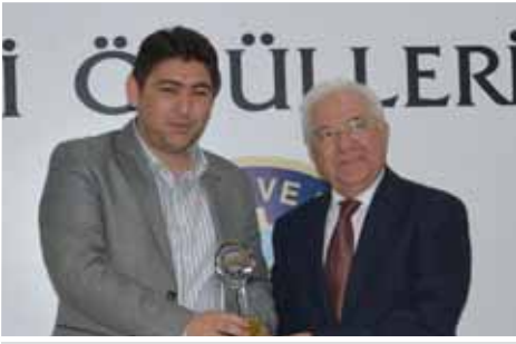
Kula İstihdam 1. Özümucu Gıda