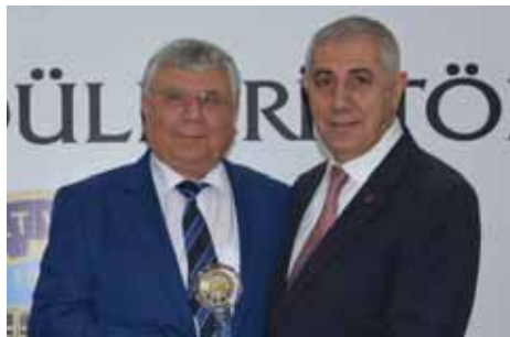
Selendi Kurumlar 2. Kayasan