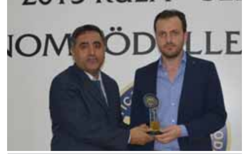
Kula Kurumlar Vergisi 10. Özince Otomotiv