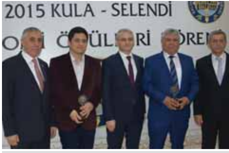
Kula Kurumlar Vergisi 1. Özmumcu - 2. Kaya Motorlu Araçlar