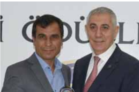
Selendi Kurumlar 1. Emmioğlu