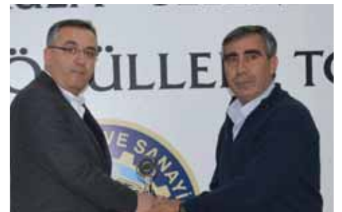
Kula İhracat 6. Kollagen Deri