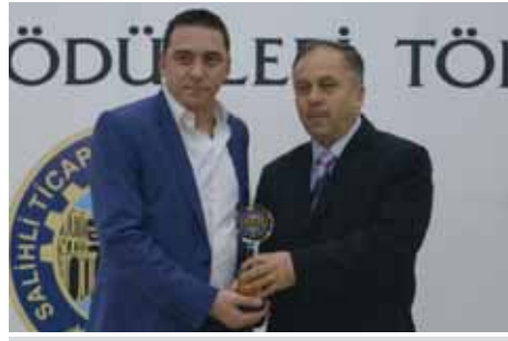
Kula Kurumlar Vergisi 4. Sönmez Tarım