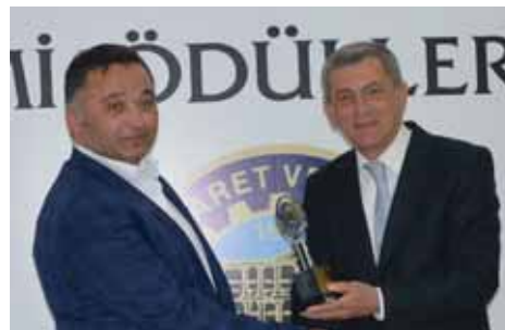
Kula İhracat 2. Yurttaş Tarım