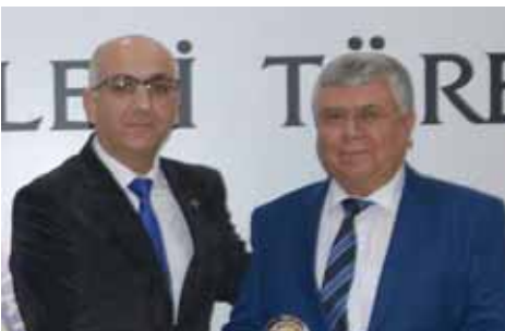
Selendi Kurumlar 6. Kayataş