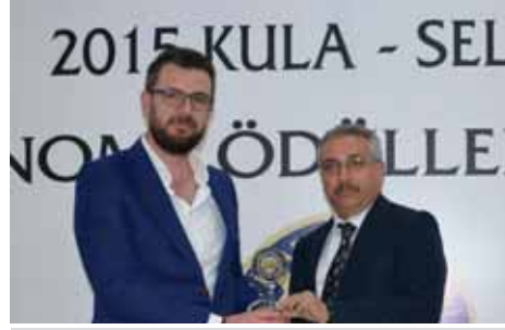
Kula Kurumlar Vergisi 8. Kimpa Ltd. Şti.