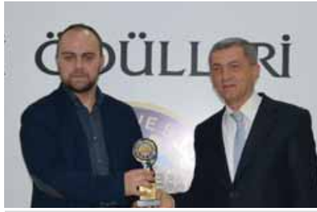
Kula İstihdam 2. İmamoğlu Tekstil