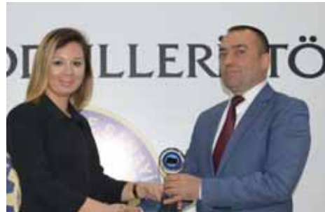
Kula Gelir Vergisi 7. İkbâl Var