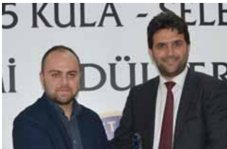
Kula İhracat 1. İmamoğlu Tekstil