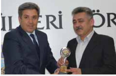
Kula Kurumlar Vergisi 6. Akdoğan Petrol