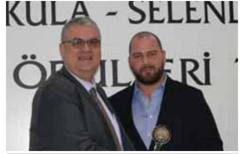
Kula İstihdam 3. Kula Madensuyu