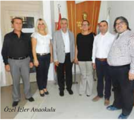
Özel İzler Anaokulu