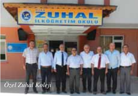
Özel Zuhâl Koleji