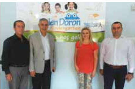
Özel Helen Doron Anaokulu