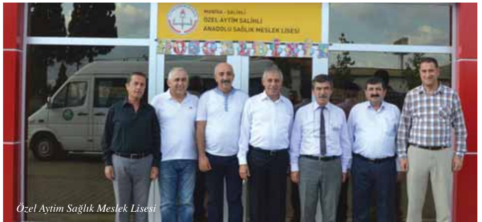
Özel Aytım Sağlık Meslek Lisesi