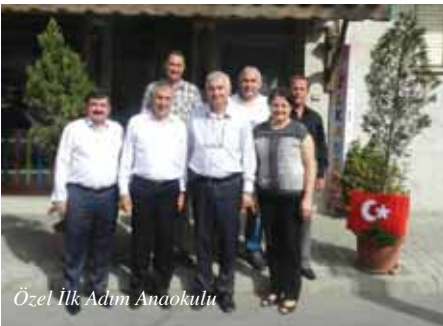
Özel İlk Adım Anaokulu