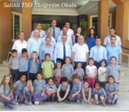
Salihli TSO İlköğretim Okulu