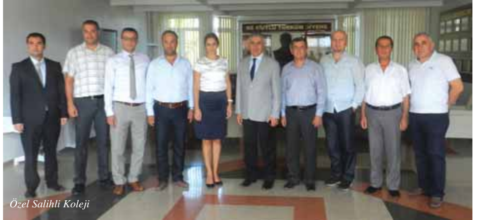
Özel Salihli Koleji