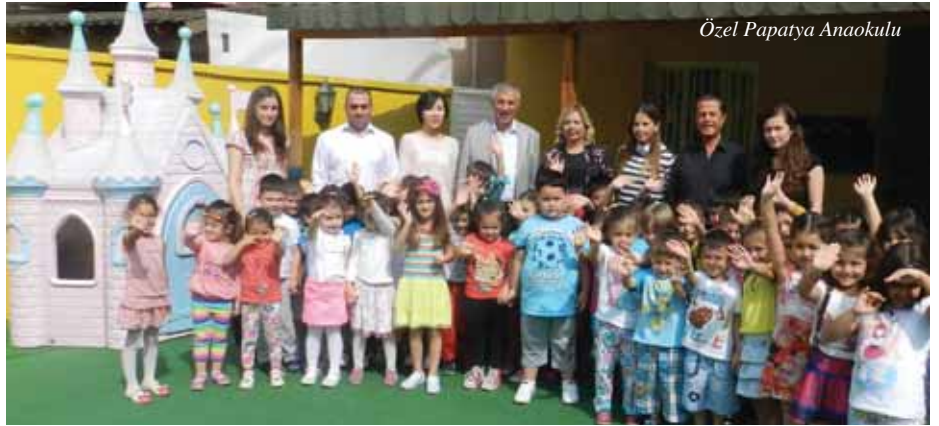
Özel Papatya Anaokulu