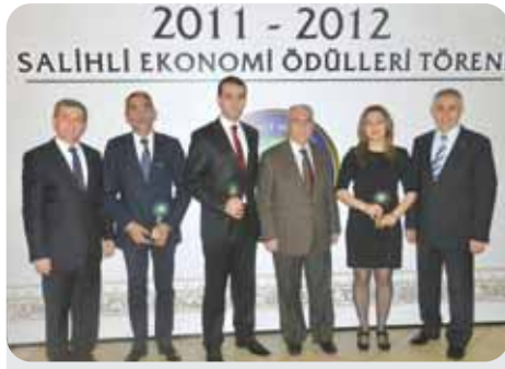
2012 İhracat Vergisi 1. 2. 3.