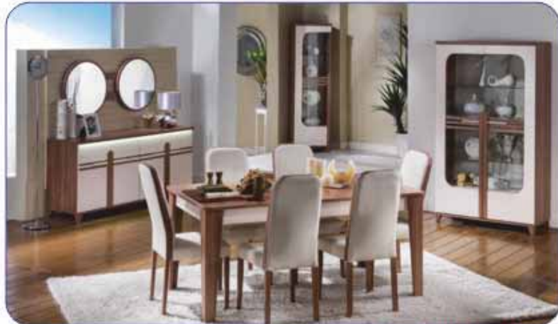
VEGES YEMEK ODASI TAKIMI