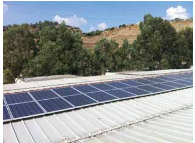
Sünerler İplik Fabrikası 45 kW GES