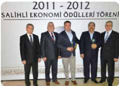
2012 Gelir Vergisi 9. 10.