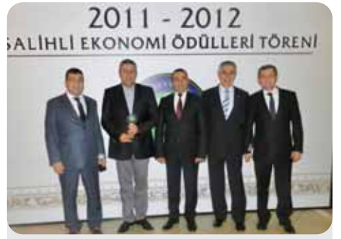
2012 İhracat Vergisi 4. 5.