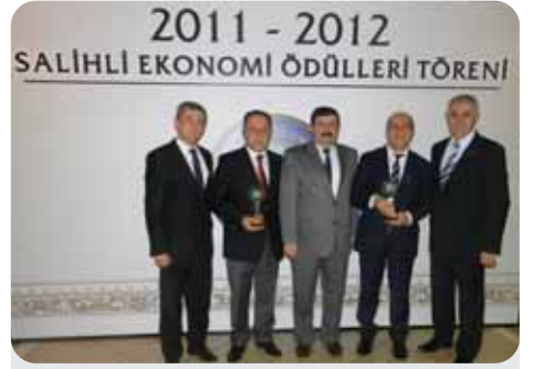
2012 İstihdam 3. 4.