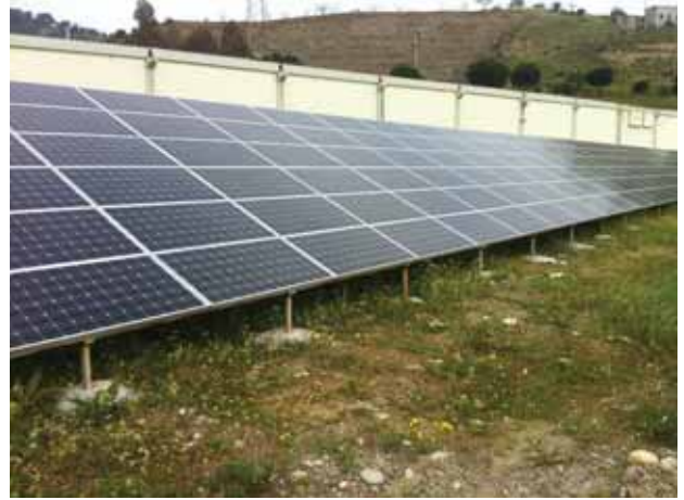
Sünerler İplik Fabrikası 45 kW GES