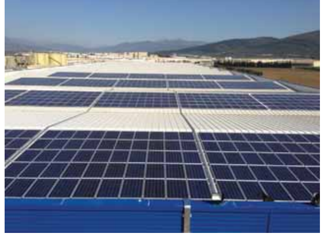
REYSAŞ 250 kW RES