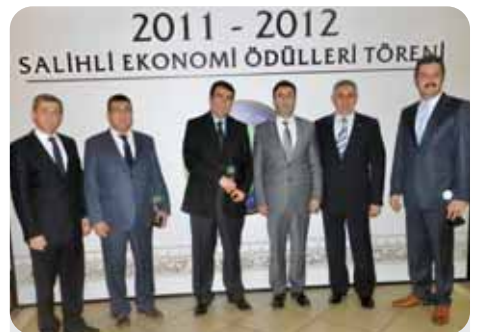
2012 Kurumlar Vergisi 6. 7. 8.