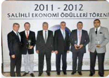
2012 İhracat Vergisi 6. 7. 8.