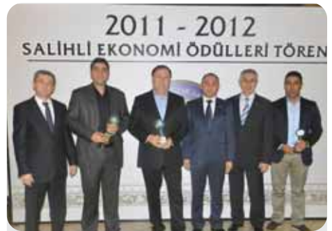
2012 Gelir Vergisi 6. 7. 8.