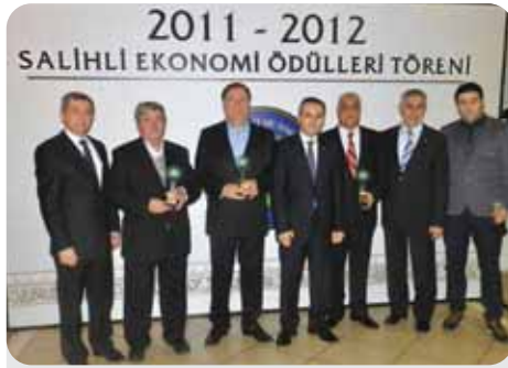
2011 Gelir Vergisi 6. 7. 8. 9. 10.