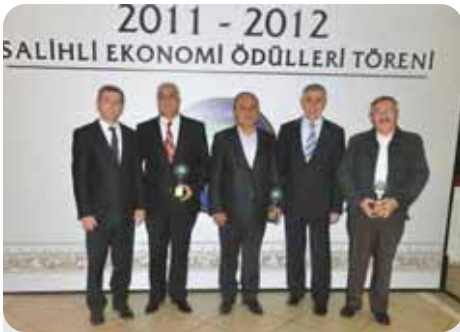
2012 Gelir Vergisi 1. 2. 3.