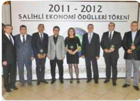
2011 İhracat Vergisi 1. 2. 3. 4. 5.