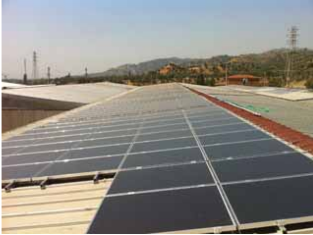
Sünerler İplik Fabrikası 55 kW GES