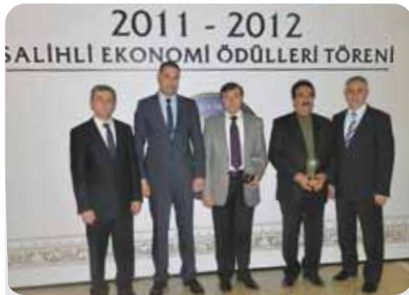
2012 Gelir Vergisi 4. 5.