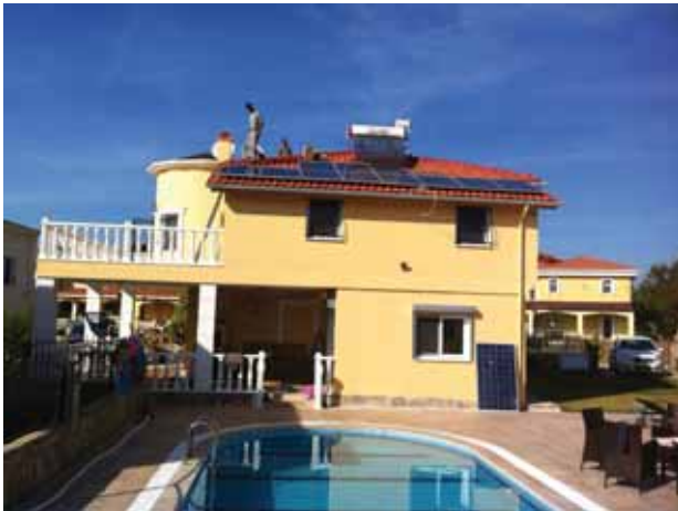
3 kW GES Kuşadası Villa