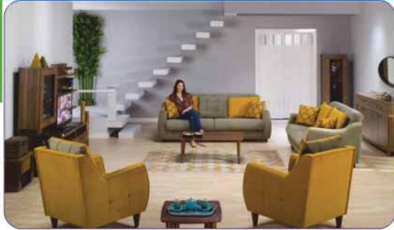
VENÜS KOLTUK TAKIMI

Adres: Menderes Caddesi Nu: 59/A Tel: 715 10 07 SALIHLI