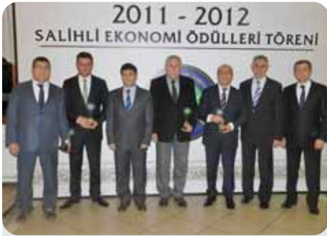
2011 Kurumlar Vergisi 6. 7. 8. 9. 10.