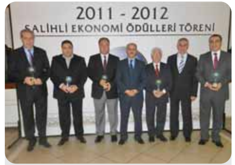
2011 Kurumlar Vergisi 1. 2. 3. 4. 5.