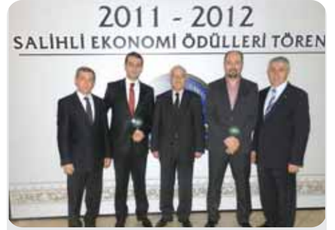
2012 İstihdam 9. 10.