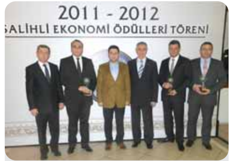
2011 İhracat Vergisi 6. 7. 8. 9. 10.