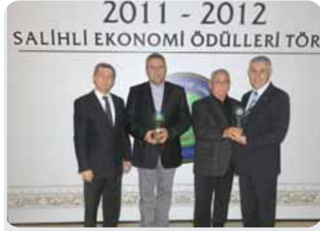
2012 İstihdam 1. 2.