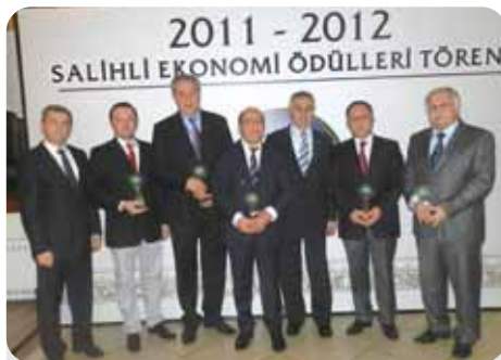
2012 Kurumlar Vergisi 1. 2. 3. 4. 5.