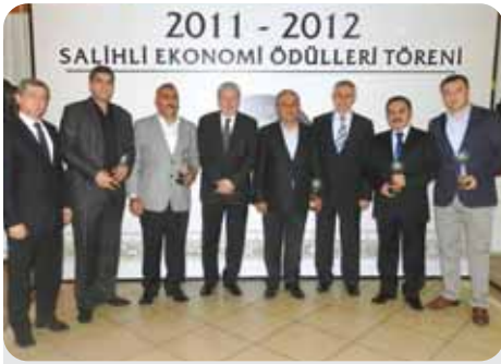
2011 Gelir Vergisi 1. 2. 3. 4. 5.