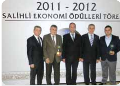
2012 İstihdam 5. 6.