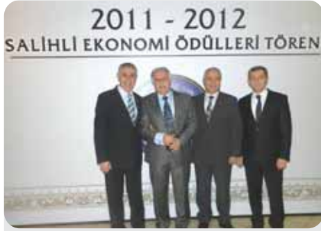
2012 İstihdam 7. 8.