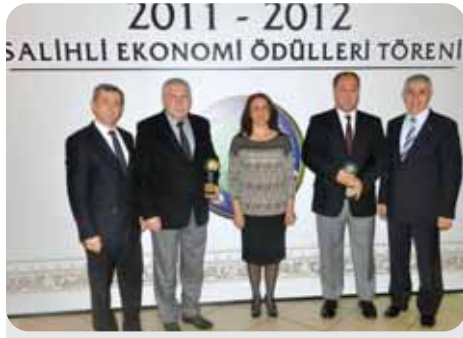
2012 Kurumlar Vergisi 9. 10.