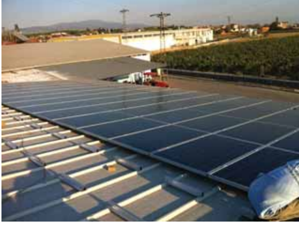
Güres 30 kW GES